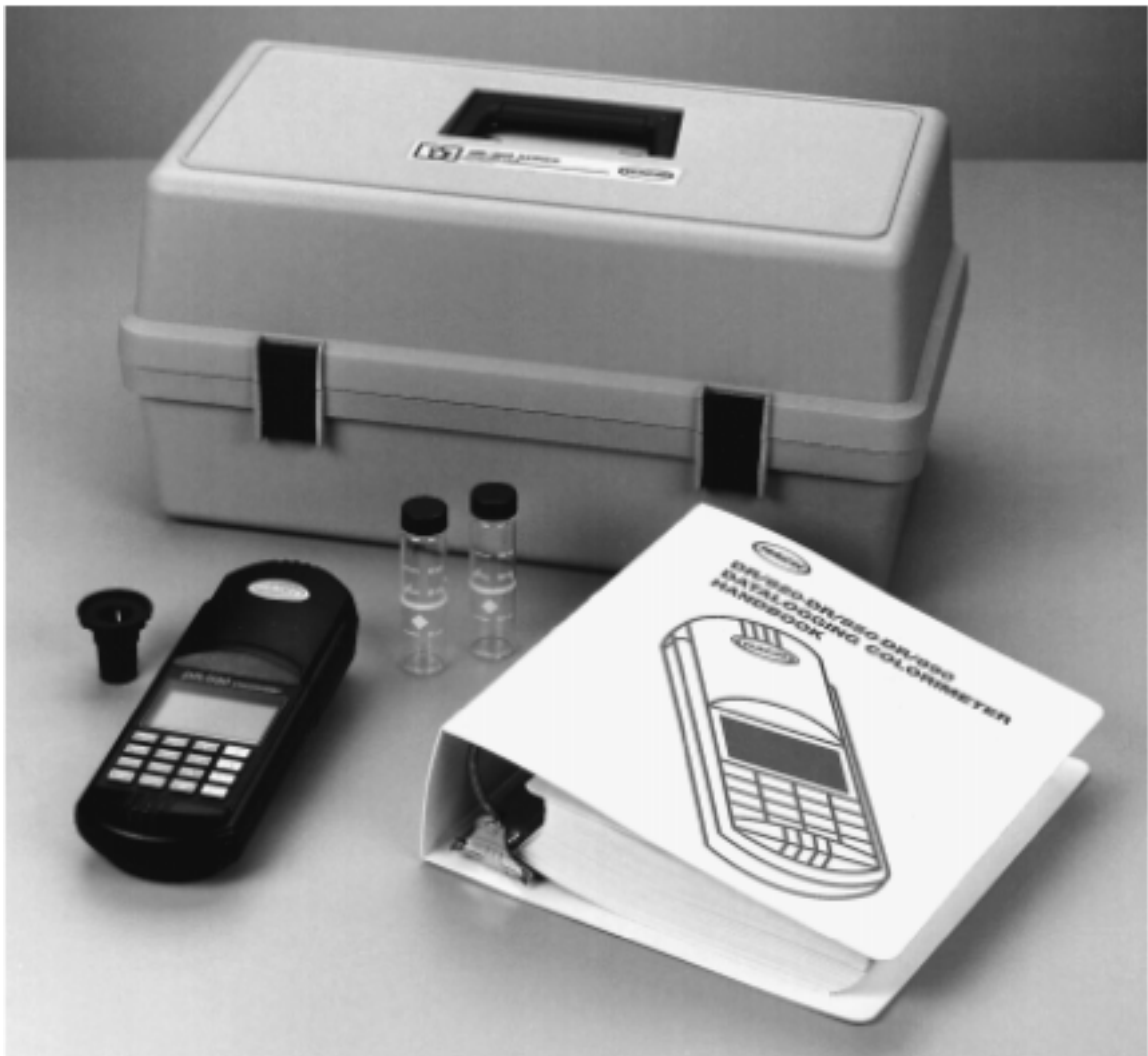
图 1 DR/800 系列色度仪标准包装*